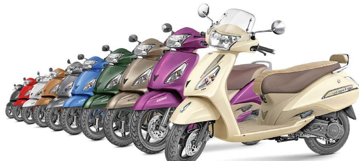
டி.வி.எஸ். ஜூபிடர் ஸ்கூட்டர் 20 லட்சம் விற்பனை செய்து சாதனை படைத்துள்ளது.